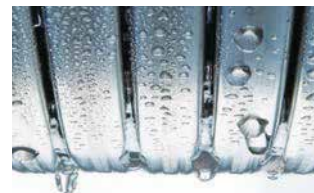
Intercambiador de calor Inox-Radial de acero inoxidable