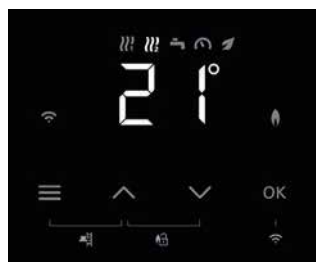
Display LCD con pantalla y botones táctiles