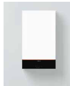
Vitodens 100-W (B1HF y B1KF)