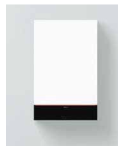
Vitodens 111-W (B1LF)