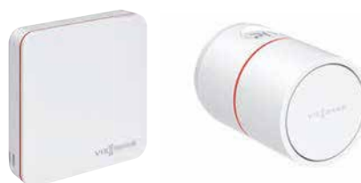
Termostato y cabezal termostático inteligente ViCare para mayor comodidad y eficiencia